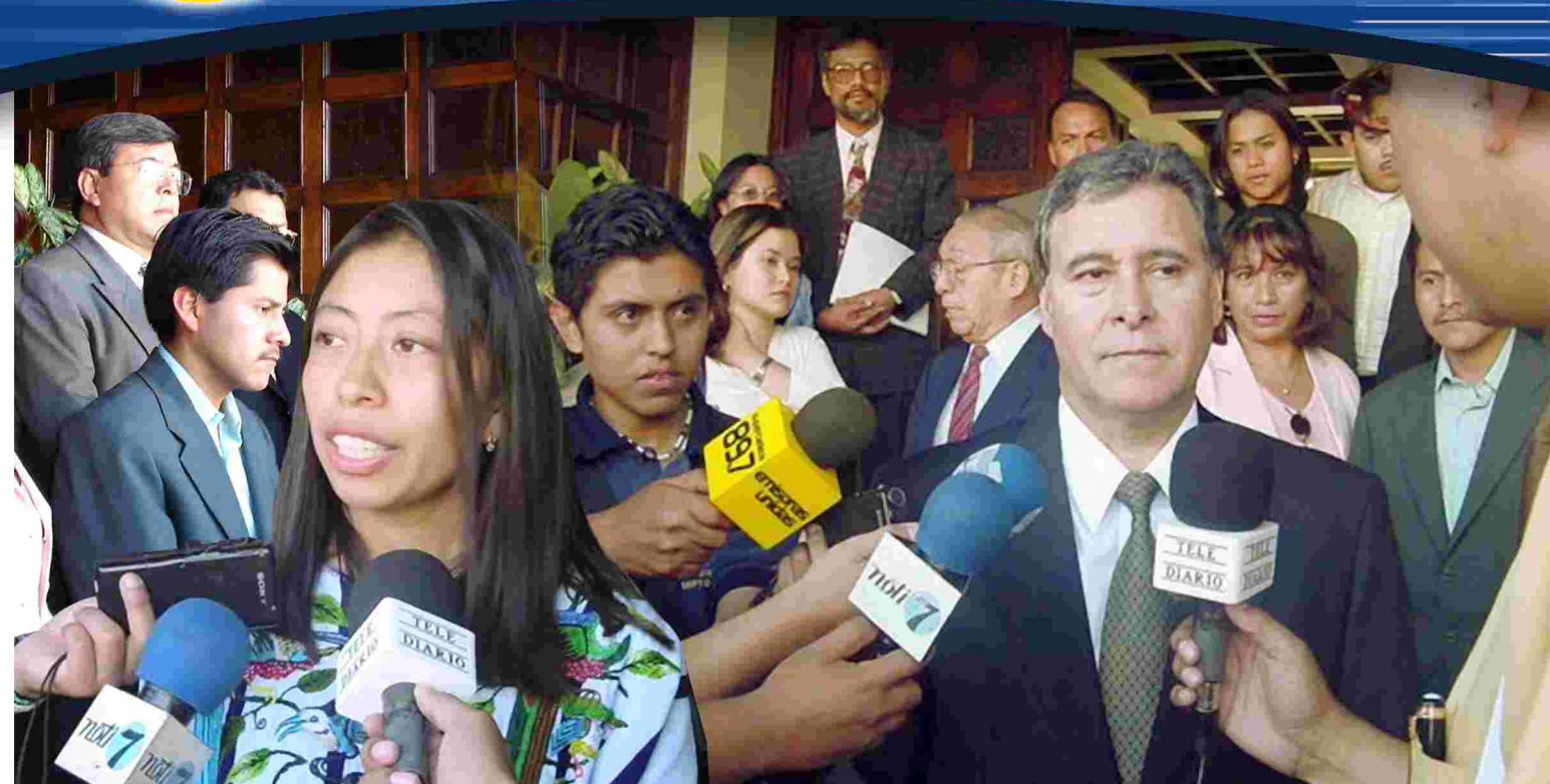
Momentos durante la presentación de la Acción de Inconstitucionalidad.